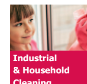
Industrial & Household Cleaning

Roh- und Wirkstoffe für Haut- und Körperpflegeprodukte, Mundpflege und dekorative Kosmetik